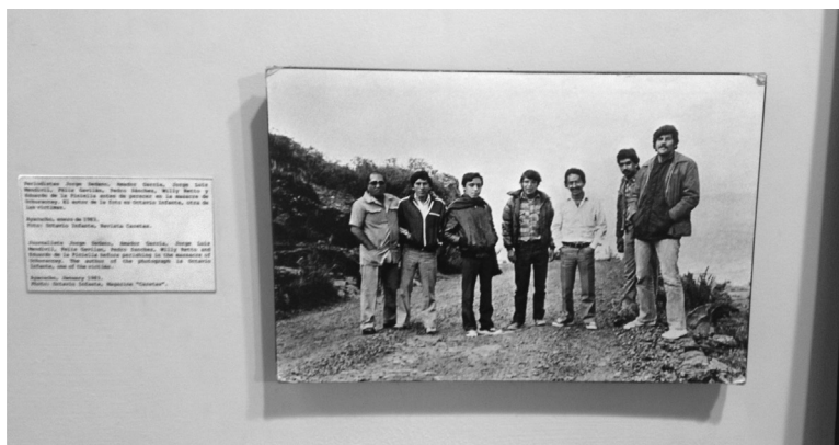
Figura 3. Primera imagen del Caso Uchuraccay en la exposición «Yuyanapaq. Para recordar».