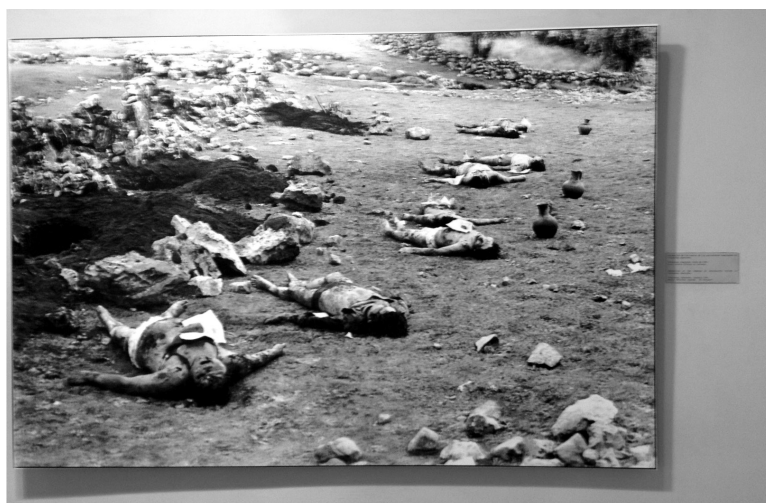
Figura 4. Segunda imagen del Caso Uchuraccay en la exposición «Yuyanapaq. Para recordar».